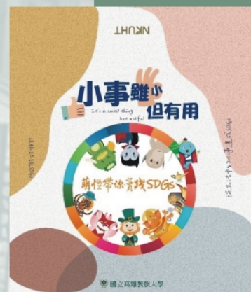
圖書館館員所創作的認識SDGs桌遊《小事雖小但有用——萌怪帶你實踐SDGs》外盒設計