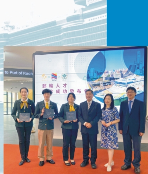
郵輪服務人才需船員證 英文能力不可或缺

高雄餐旅大學校長陳敦基表示：長期以「人文化」、「專業化」、「企業化」和「國際化」為教育理念，落實「本土紮根、國際拓伸」宗旨，現在有國際郵輪可登船實習，可開闊學生國