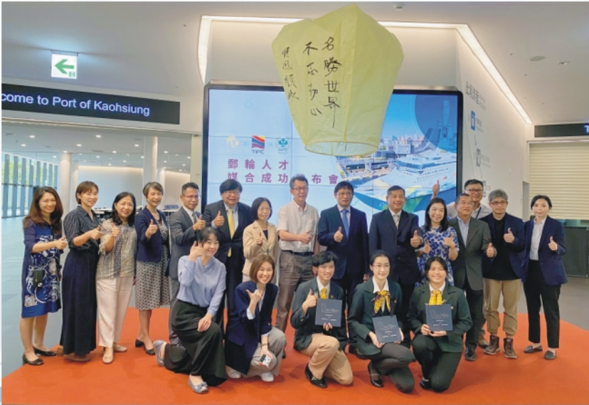
高餐大培育郵輪服務人才有成 備受肯定