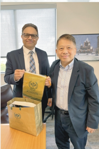
高餐大將與美波士頓大學晤談1+1雙聯碩士

象徵雙方合作的進一步深化。JWU位於羅德島，在廚藝和酒店管理領域成就卓越而聞名，是美國新英格蘭地區餐旅廚藝教育的翹楚。JWU擁有商學院、廚藝學院、酒店管理學院及人文科學院四個學院，特別是廚藝和酒店管理專業在全美排名前10。這回訪問中，JWU副校長及教務長隆重接待，雙方並簽署升級為校級姊妹校的合作備忘錄(MOU)，並計劃在未來加強學生交換和教師短期支援課程等領域的合作。