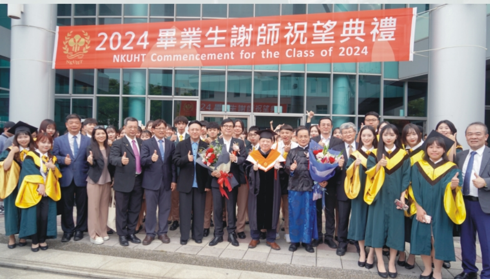
市長與陳敦基校長及許添財讚禮官合影

國立高雄餐旅大學創校38年，迄今仍延續古禮儀式，今年畢業典禮由校長陳敦基主持，邀請到高雄市長陳其邁為貴賓代表，財團法人商業發展研究院董事長許添財擔任讚禮官，來為畢業生致詞勉勵，台上特地以椰笛、笙、琵琶、二胡、大阮等古樂組成的樂團演奏校歌及驪歌，氛圍格外不同，典禮中有學生代表上台跪拜，感謝師長無私無尤的教導，代表高餐大尊師重道的優良傳統，隆重感人，讓在場畢業生與家長都感受到高餐大獨幟一格的辦學理念。