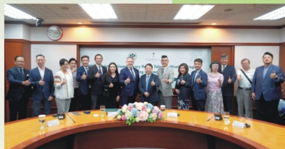
嘉佩樂酒店集團與高餐大同仁合影

國立高雄餐旅大學繼今年初與台北文華東方酒店及台北W飯店簽訂育才扎根計劃後，再次與