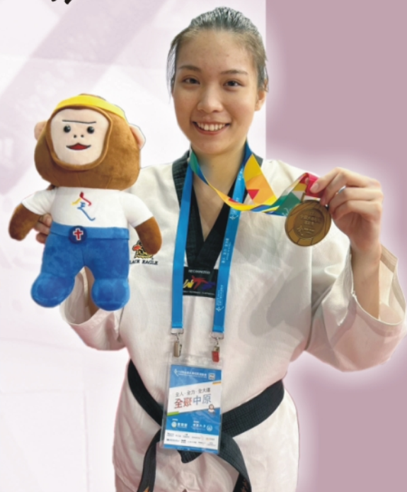
跆拳道賽場上的常勝軍