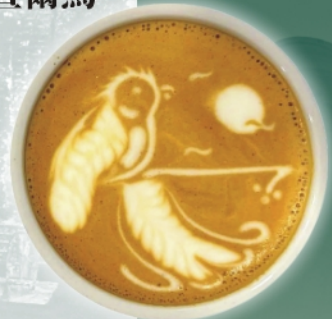
奶泡拉出的瓜地馬拉國鳥維妙維肖