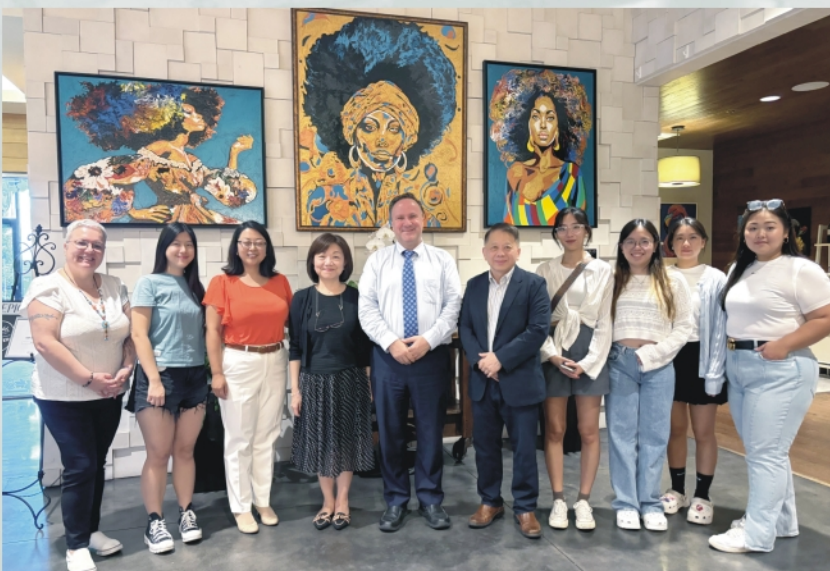
南佛羅里達大學(USF)為美知名餐旅學院

此次訪美行程，高雄餐旅大學不僅鞏固了現有的國際合作關係，還成功開拓了新的合作夥伴。無論是在學生交換、教師交流，還是跨域學習及雙聯學位項目上，這些新的合作協議將為高餐大的國際化發展注入新的動力。高餐大將繼續致力於推動全球化教育，為學生提供更多的國際學習與實習機會，開創更廣闊的未來。