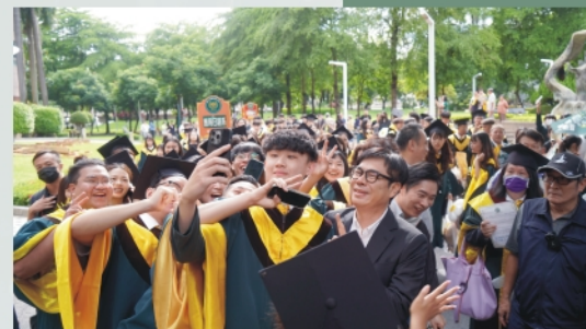
學生爭相與市長拍照