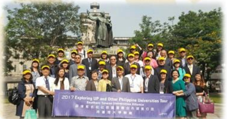
▲亞洲第一所大學-聖托瑪斯大學