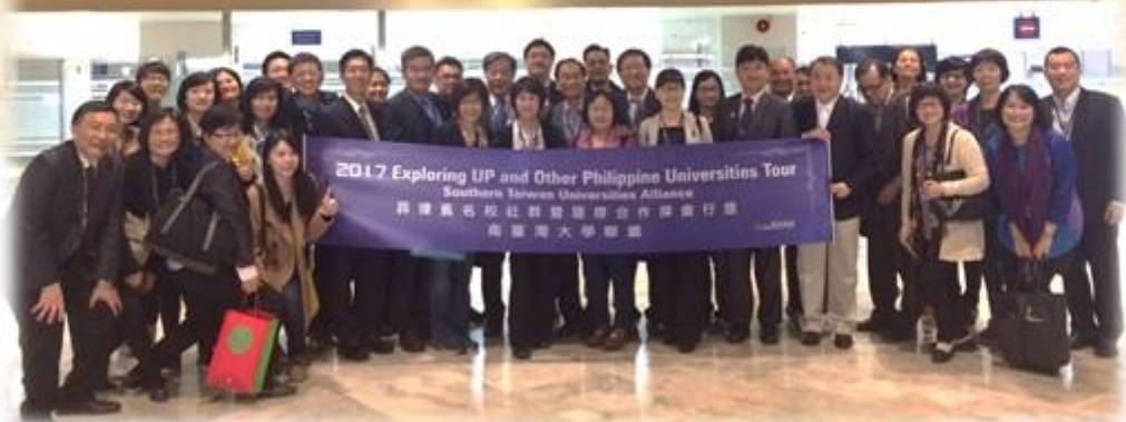
▲南台灣大學聯盟成員合影