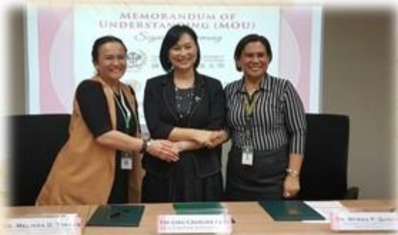
▲與菲律賓遠東大學重締結姊妹校

本次參訪團集結各方人士鼎力協助，包括台灣駐菲律賓代表辦事處林松煥大使及其同仁，南台灣大學聯盟是為近年最具規模的菲律賓教育參訪團，與國立菲律賓大學系統UP SYSTEM的密切聯繫是活化南台灣教育的新力量，不僅媒合成功件數節節上升，更成功建立臺菲兩國的教育夥伴關係。