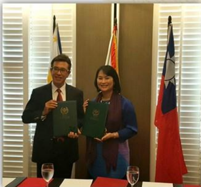
▲與菲律賓萊西姆大學簽定姊妹校

本國立高雄餐旅大學為南台灣大學聯盟學校，於105年11月20日正式與國立菲律賓大學UNIVERSITY OF PHILIPPINES總校締結姊妹校，此次參與南台灣大學聯盟菲國行旅，至菲律賓多所世界知名大學進行參訪行程，並簽立合作備忘錄，藉此加深台菲雙方學術交流，參訪對象分別有菲律賓餐旅著名學校菲律賓萊西姆大學LYCEUM OF THE PHILIPPINES UNIVERSITY、亞洲歷史最悠久規模最大的聖托瑪斯大學UNIVERSITY OF SANTO TOMAS、全球著名教育機構德拉薩大學DE LA SALLE UNIVERSITY、菲律賓國立大學馬尼拉校區UP MANILA以及迪里曼校區UP DILIMAN、菲律賓最優秀的商科類學院亦為菲律賓四大名校之一的馬尼拉雅典耀大學ATENEO DE MANILA UNIVERSITY，通過本次行旅，我校與LYCEUM OF THE PHILIPPINES UNIVERSITY以及FAR EASTERN UNIVERSITY兩所餐旅相關大學締結為姊妹校，希望未來能夠互惠雙方學生，深化台菲教育合作。