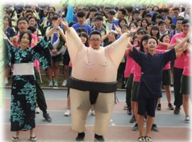
▲高餐大校運會應用日語系「相撲」大力士男化妝進場，引人注目。

高餐大今年運動會，各系學子為贏得精神總錦標，無不全力以赴，發揮創意打扮造型。像是應用日語系運動員穿上日式衣服，並特地打扮「相撲」大力男進場，引起注目。中西廚藝系運動員，穿上各式各樣工作服，手持鍋鏟，營造廚藝教學特色。另外，各系及外籍學生運動員精神抖擻入場，展現必勝的企圖心。此外，現場展現雄壯有力國軍刺槍術、青春活力的啦啦隊比賽以及激烈拔河競技，在在吸引人群觀賞，歡呼聲與掌聲不絕於耳，熱鬧滾滾。