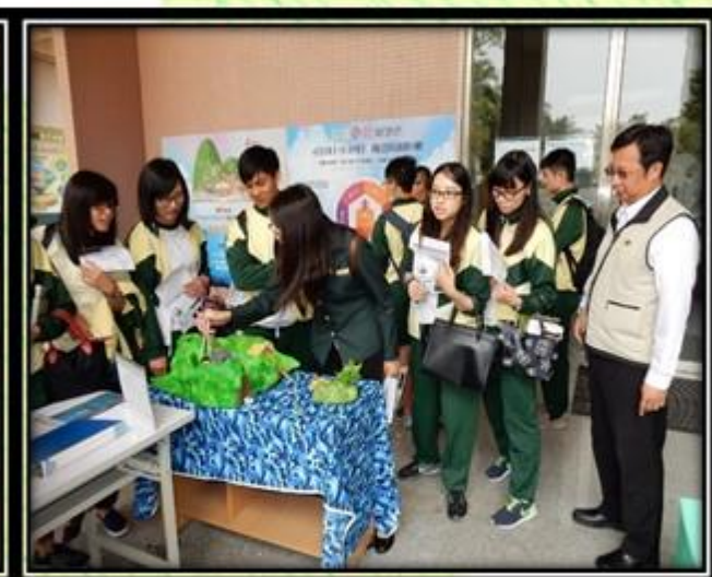
▲同學們與館長參與盛況