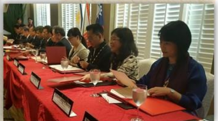
▲南台灣大學聯盟於菲律賓萊西姆大學簽約儀式