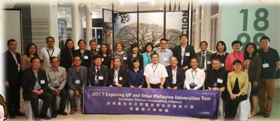
▲南台灣大學聯盟與UP MANILA合影