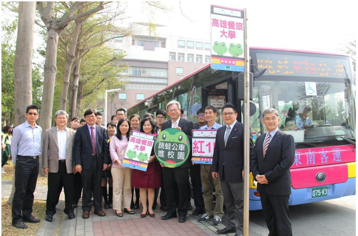
▲高餐大跳蛙公車正式啟動（右四為高雄市交通局陳局長勁甫）。

為改善大專院校學生騎乘機車肇事率偏高的情形，市府交通局與國立高雄餐旅大學合作，自2月26日開學日起，規劃紅1B公車採用跳蛙方式，直捷往返校內與小港轉運站（捷運小港站）之間，由原來約20分鐘車程縮短為12分鐘，成為學生的最愛；交通局希望藉由更便捷的公共運輸，鼓勵全校師生搭乘公車，減少騎乘機車人數，降低交通事故及傷亡情形，維護師生通學的交通安全。