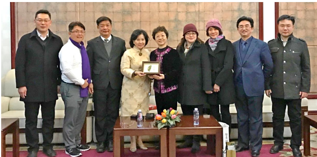
◀ 與北京財貿職業學院進行學術交流。