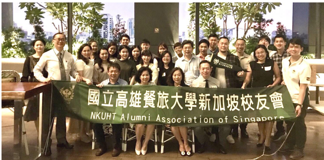
▲國立高雄餐旅大學林玥秀校長與新加坡校友們合照。

國立高雄餐旅大學的使命在於培育亞洲優質餐旅人才搖籃，校長勉勵海外校友擦亮高餐大品牌，在觀光餐旅業發揮所學，貢獻社會，是台灣與新加坡最好的連接橋樑。