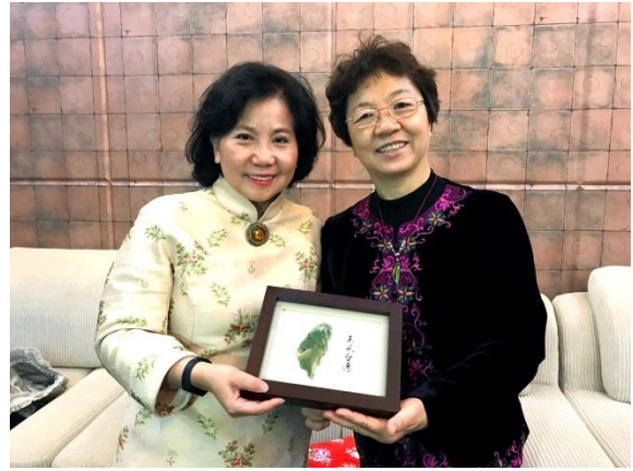
▲ 與北京財貿職業學院進行學術交流，畫面右為北京財貿職業學院高東黨委書記。